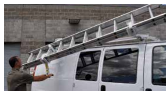
Support à échelle "LoadsRite" à descente latérale