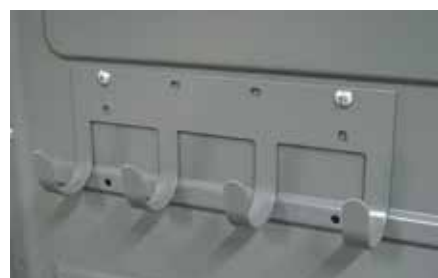
Barre à Crochets