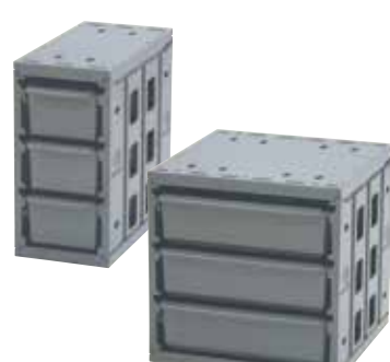
Composantes de Tiroirs