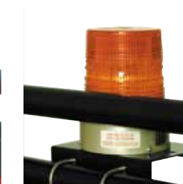
Plaque de montage pour lumière BS2