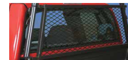
Grille de fenêtre WG21