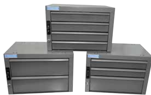
Unités de Tiroirs