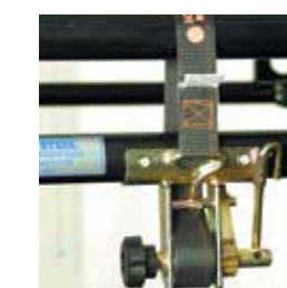
Courroie à cliquet RS3