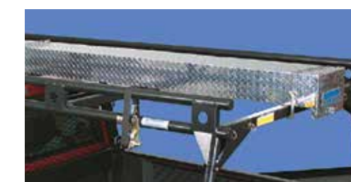
Tube conducteur en aluminium #80-1 10 pi., 6 po. #80-2 16 pi., 6 po.