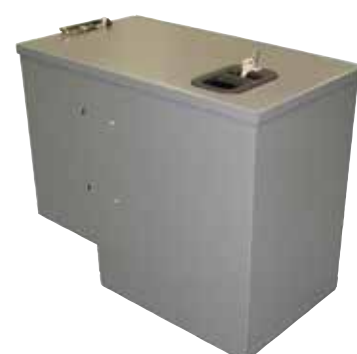
Coffre de Cabine pour Dossiers