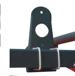
Trousse de retenue d'échelle LS4