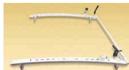
Support à échelle simple GripLock