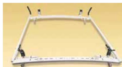
Support à échelle double GripLock