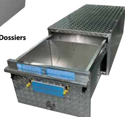
Tiroirs de Plancher en Aluminium