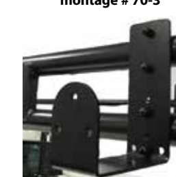
Crochet utilitaire LRA-UH1