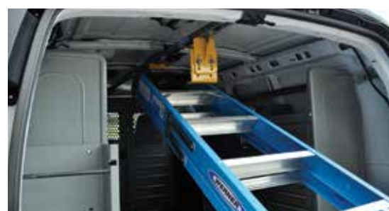
Support à échelle "Ladder Keeper"