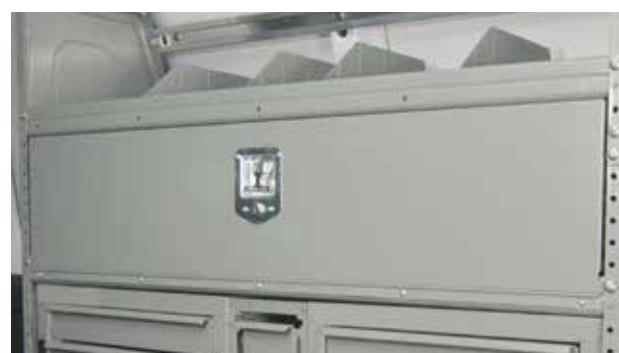
Ensemble de Porte