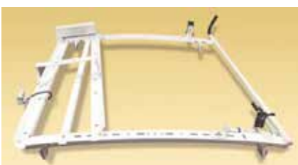
Support à échelle deluxe